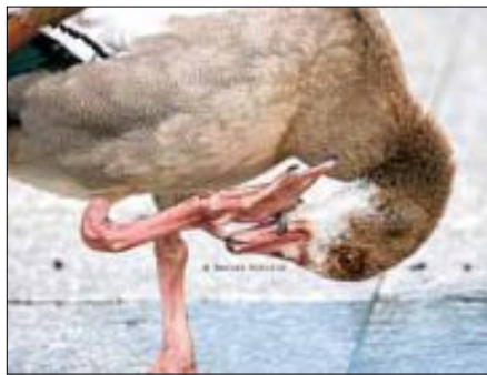
Junge Nilgans 'Daniela' mit Schnabel-Zungen-Piercing

Kein X-Phänomen ist, dass die schmutzige NilgansTeenie 'Daniela' seit Anfang Juli mit dem Handicap eines im Schnabel feststehenden grünen Fruchtsaft-Kunststoff-Rings leben muss.